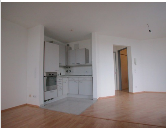
Wohnraum mit Küche

Zimmer: 1,50 Wohnfläche ca.: 44,36 m 2 Kaufpreis: 266.000,00 EUR